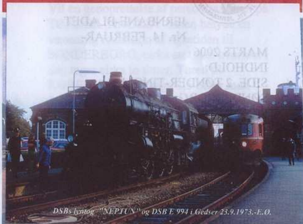
DSBs lyntog "NEPTUN" og DSB E 994 i Gedser 23.9.1973.