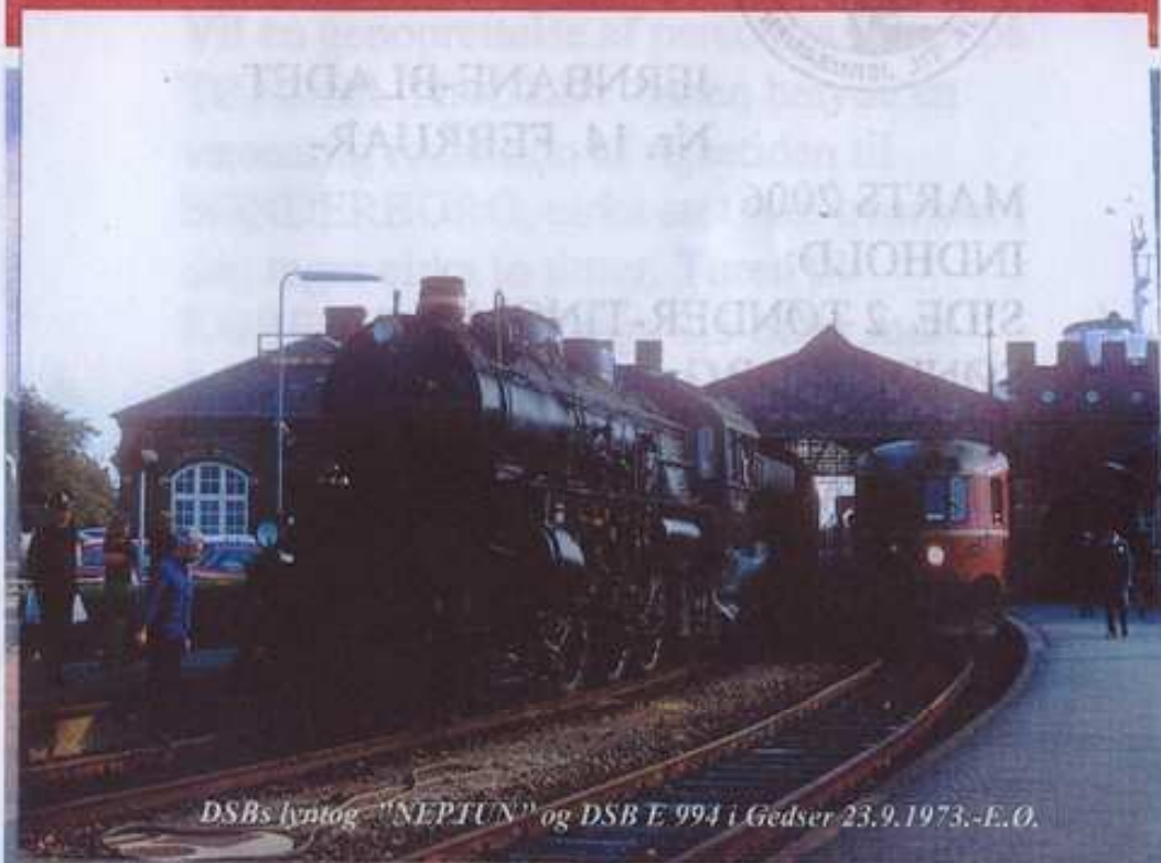
DSBs lyntog "NEPTUN" og DSB E 994 i Gedser 23.9.1973.